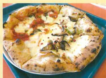
真鶴ピザ *うずわとトマト&さばみりんトリコッタース *うずわ=奈田ガツオ